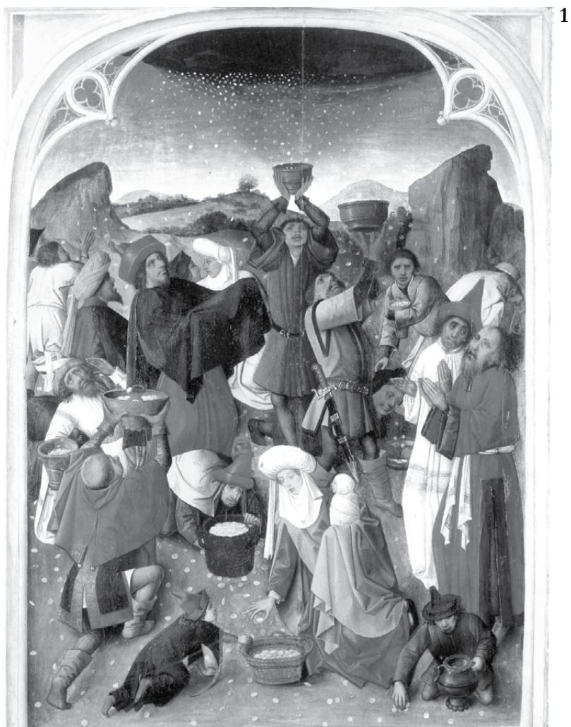
1 Mestre do Maná – “A colheita do Maná” – 1470.